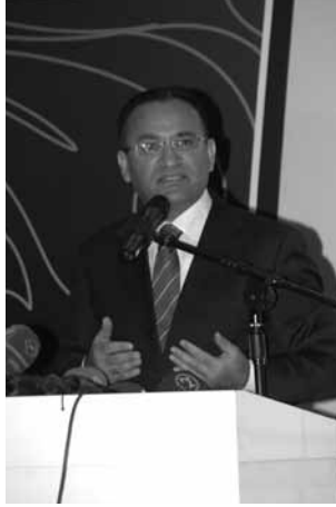
Bekir BOZDAĞ Başbakan Yardımcısı

Diyanet İşlerimizin saygıdeğer başkanı, Memur-Sen sendikamızın değerli başkanı, Diyanet-Sen'in kıymetli başkanı ve saygıdeğer misafirler, ben de sözlerimin başında hepimizi sevgi ve saygıyla selamlıyorum.