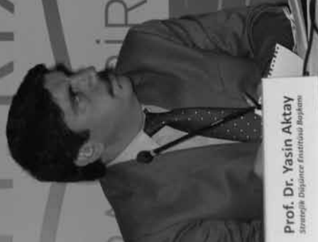
Prof. Dr. Yasin Aktay Siyasetçi, Düşüncü Kuruluşu Başkanı