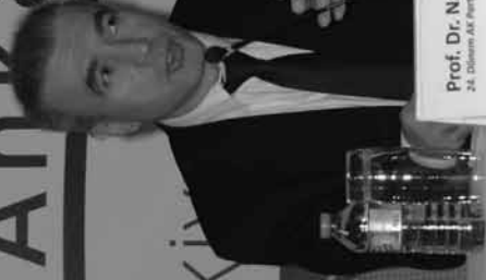
Prof. Dr. Naci Bostancı 24. Dönem AK Parti Amasyra Milletvekili