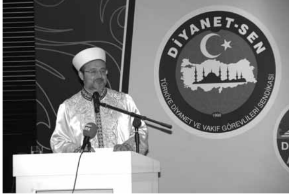
Prof. Dr. Mehmet GÖRMEZ Diyanet İşleri Başkanı

Bismillahirrahmanirrahim. Elhamdülillahi Rabbil alemin. Essalatü vessalamü ala Rasulina Muhammedin ve ala alihi vessahbihi ecmain.