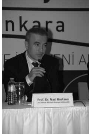
Prof. Dr. Naci BOSTANCI Amasya Milletvekili

Siyasetle okur-yazarlık arasında bir çelişki, muvazene, köşe yazılarımızda söylediklerimiz galiba. Çok öyle değil diye düşünüyorum. Ama neticede hep birlikte, en azından kendi adımıza göreceğiz.